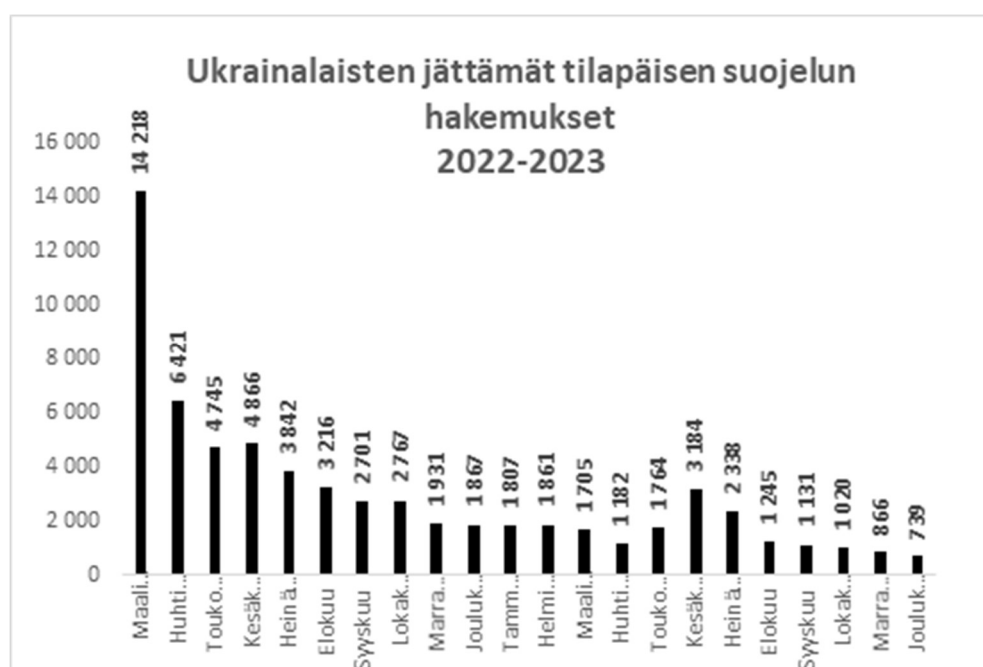
Taulukko 2: tilapäistä suojelua hakeneet ukrainalaiset 2022–2023

Suomessa on jätetty vuoden 2023 loppuun mennessä yhteensä noin 65 500 tilapäisen suojelun hakemusta, joista noin 18 800 vuonna 2023. Vastaanottojärjestelmässä tilapäistä suojelua saavia on tällä hetkellä noin 27 200.